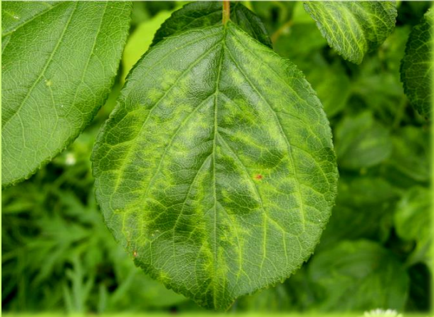
はんもん 退緑斑紋（ウメ）