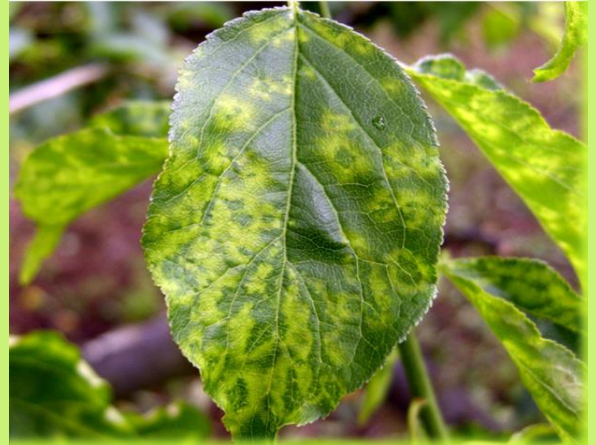
りんもん 黄色輪紋（ウメ）