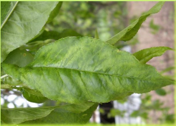
はんもん 退緑斑紋（モモ）