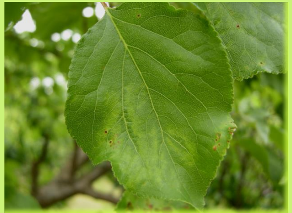
はんもん 退緑斑紋（アンズ）

このウイルスは植物に感染するものであり、 ヒトや動物に感染することはありません。 また、感染している樹の果実を食べても問題はありません。