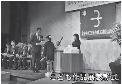
こども作品展表彰式

また、小学4～6年生を対象に「チャレンジクラブ」を開催し、年間を通して、次のようなプログラムを実施しています。