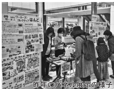
昨年のパネル展示の様子

ひろとんは、市内を主な拠点とし、さまざまな分野で活動をしている市民公益団体が、パネル展示やステージ発表などを通じて、それぞれの活動内容や課題を発表することで、広く市民の皆さんに知っていただき、市民の皆さんが主体となってまちづくりをしていく市民公益活動を盛り上げるきっかけにすることが、一つの目的になっています。