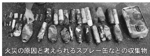
火災の原因と考えられるスプレー缶などの収集物

先日、錦ヶ丘町府宮住宅のごみ収集時に収集物が原因と考えられる、ごみ収集車の火災事故が発生しました。