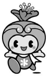
とっぴーも4月1日 で10歳になるよ

そこで本市では、令和3年3月31日(水)までの1年間を周年記念の年と位置付け、市民の皆さんと一緒に祝いできるような、さまざまな記念事業を実施します。 つきましては、70周年の当日となる4月1日に、オープニングセレモニーを開催しますので、皆さんぜひ、お越しください。 とき 4月1日(水)、午前8時30分～8時50分 ところ 市役所庁舎玄関前 ※駐車場に限りがありますので、できるだけ公共交通機関をご利用ください。 問い合わせ 情報公開課 (内線326)