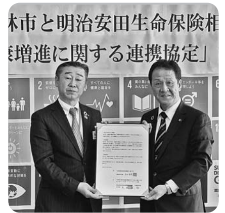
2月18日に、明治安田生命保険相互会社と健康増進に関する連携協定を締結しました。