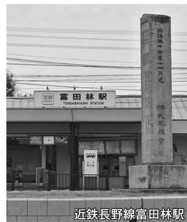
近鉄長野線富田林駅