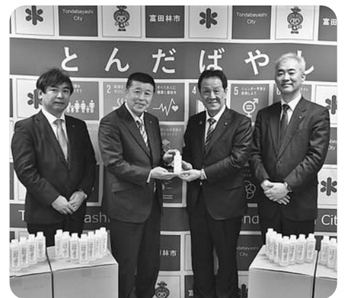
3月11日、株式会社アンズコーポレーションより、教育現場などで使用する消毒液を2016本寄贈いただきました。