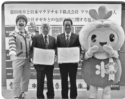
2月13日に、日本マクドナルド株式会社 フランチャイズ法人 株式会社オゼキと、包括連携協定を締結しました。