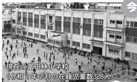
現在の富田林小学校 (令和2年2月の在籍児童数328人)