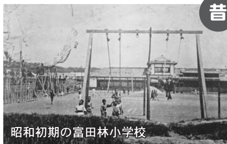
昭和初期の富田林小学校

富田林小学校は、富田林で一番初めにできた小学校です。今年で創立148年になります。