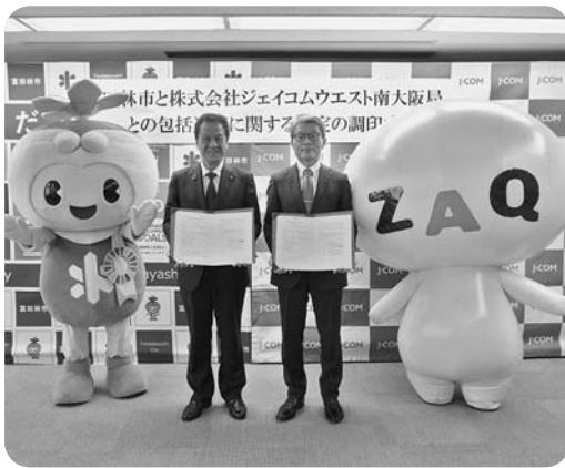
2月3日に、株式会社ジェイコムウエスト南大阪局と包括連携協定を締結しました。