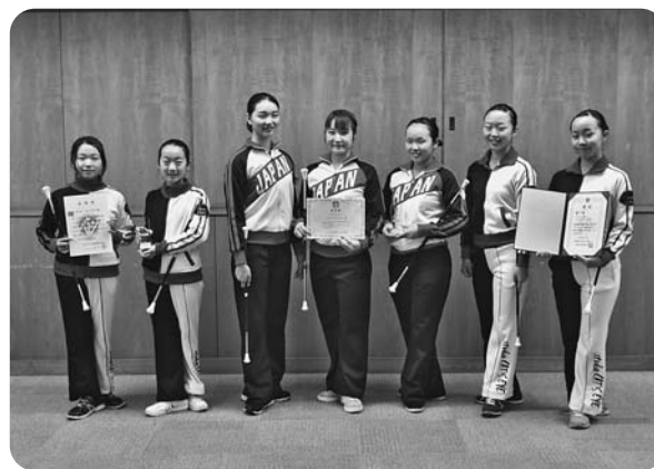
2月28日、全国大会に出場されたバドントワーリング教室スタジオキャッツアイの皆さんが市役所を表敬訪問しました。