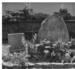
いそのかみつゆ 小 石上露子の 歌碑