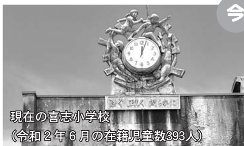
現在の喜志小学校 (令和2年6月の在籍児童数393人)