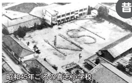
昭和45年ごろの喜志小学校

喜志小学校は、富田林市で4番目にできた小学校です。今年で創立147周年になります。