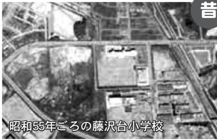
昭和55年ごろの藤沢台小学校

藤沢台小学校は、富田林市で14番目にできた小学校です。今年で創立40年になります。