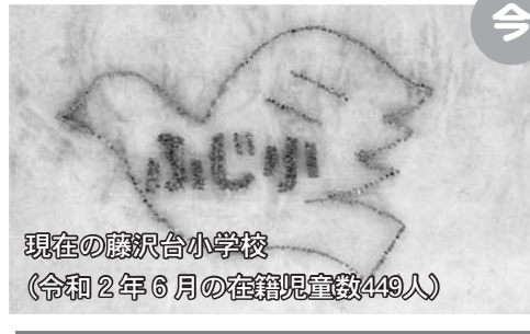
現在の藤沢台小学校 (令和2年6月の在籍児童数449人)