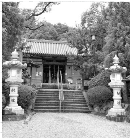
みぐくるみたま 美具久留御魂神社

昔からある由緒ある神社で、「喜志の宮さん」として人々に親しまれています。境内から見える、二上山に昇る朝日は格別です。