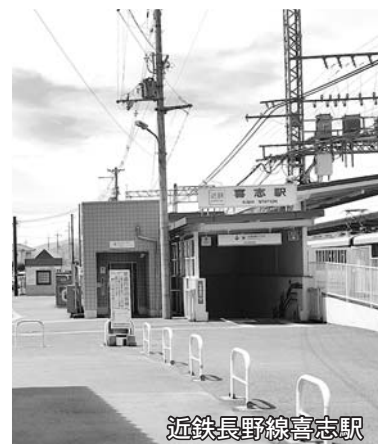
近鉄長野線喜志駅