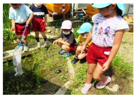
かめこの散歩タイム やっぱり池がいい