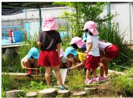
毎日ビオトープはさわがしい