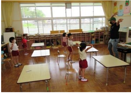
そら組 マツ先生との再会