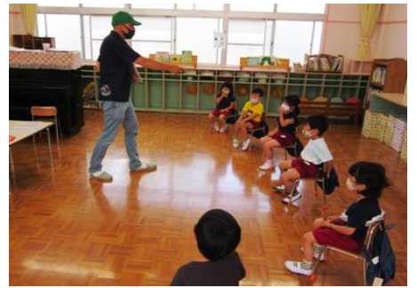
はな組 マツ先生との出会い