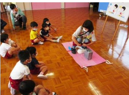
ウンチがはみださないように！