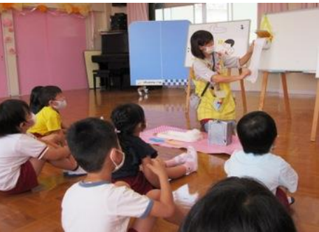
トイレトペーパーの使い方説明