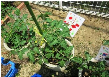
ミニトマトの看板完成！