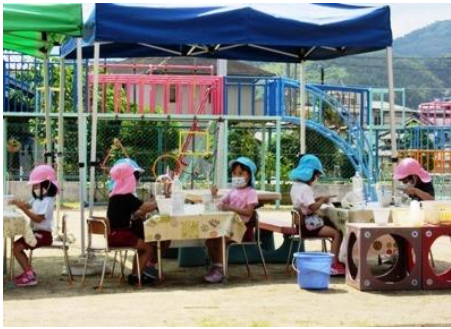
パンジーの花で色水づくり