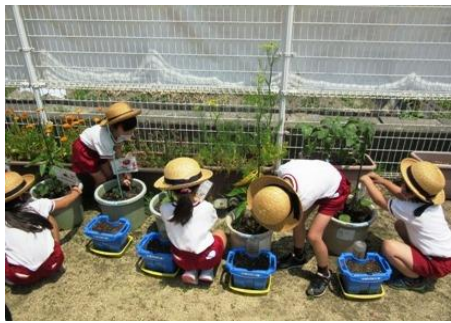
やさいの看板づくり