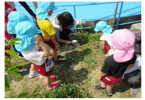
もらったオナモミの苗を植えています。