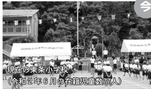
現在の東条小学校 (令和2年6月の在籍児童数77人)