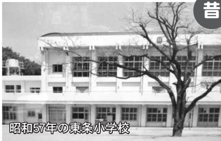
昭和57年の東条小学校

東条小学校は、富田林小学校と同じく明治5年にできた小学校です。今年で創立148年になります。