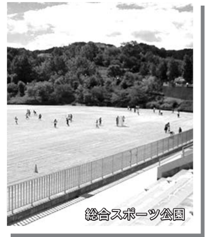
総合スポーツ公園