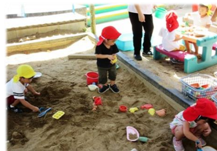
れもん組、いちご組 入り混じって砂場あそび