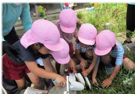
死んだカブトムシさん、お墓でゆっくりね…。