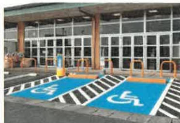
(車椅子使用者用駐車施設)