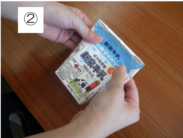
上のめんをたたむ