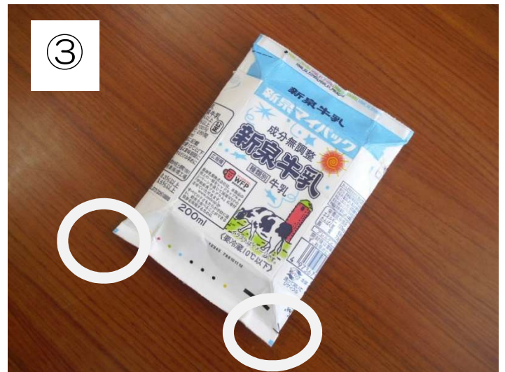
下のフラップを広げてたたむ

★飲み残しがあるときは、ストローのくちにテープを貼ってから、たたまずに配膳室に返しましょう