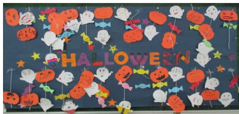
たんぽぽ学級作成