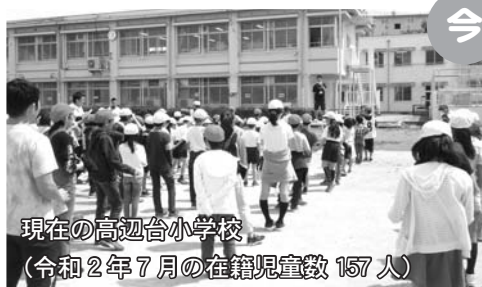
現在の高辺台小学校 (令和2年7月の在籍児童数 157人)