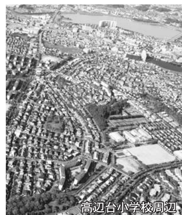
高辺台小学校周辺