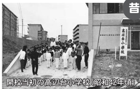
開校当初の高辺台小学校(昭和42年頃)

高辺台小学校は、富田林市で9番目にできた小学校です。今年で創立52周年になります。