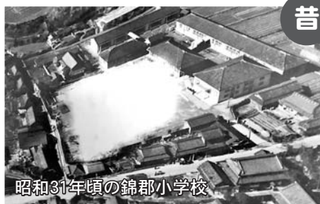
昭和31年頃の錦郡小学校

錦郡小学校は、富田林市で3番目にできた小学校です。今年で創立148年になります。