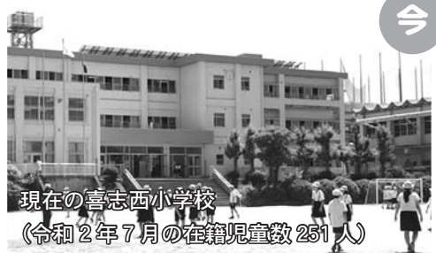
現在の喜志西小学校 (令和2年7月の在籍児童数 251人)