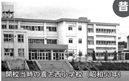
開校当時の喜志西小学校 (昭和53年)

喜志西小学校は、富田林市で13番目にできた小学校です。今年で創立42年になります。