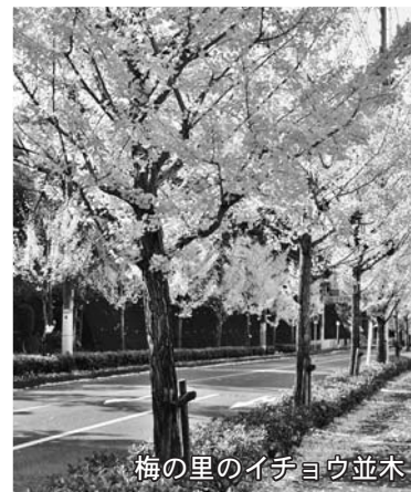
梅の里のイチョウ並木