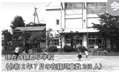
現在の錦郡小学校 (令和2年7月の在籍児童数243人)