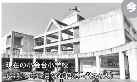
現在の小金台小学校 (令和2年12月の在籍児童数477人)