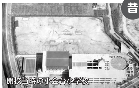
開校当時の小金台小学校

小金台小学校は、富田林市で15番目にできた小学校です。今年で創立32年になります。