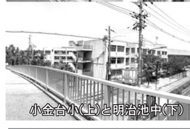
小金台小(上)と明治池中(下)