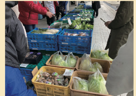
1月に開催したマルシェの様子