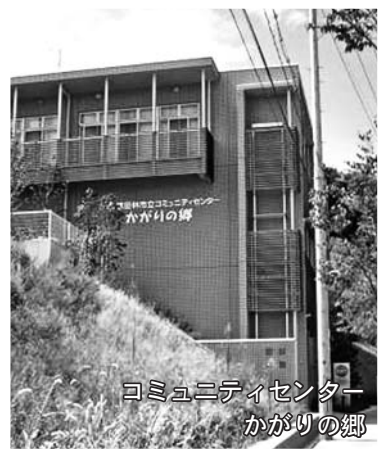
コミュニティセンター かがりの郷