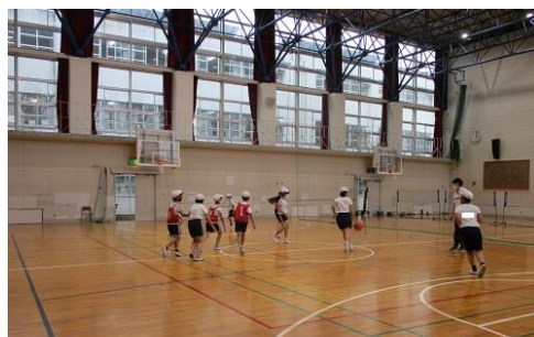
バスケットボールクラブ