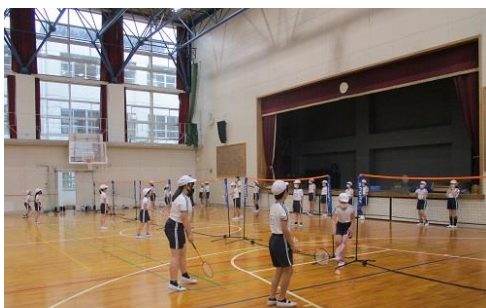
バドミントンクラブ