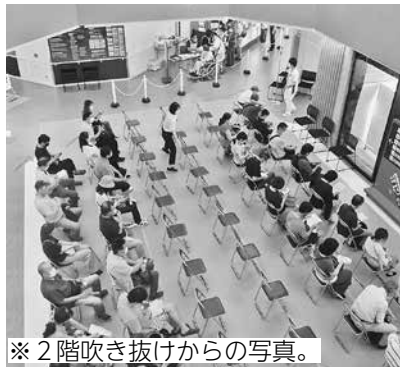
※2階吹き抜けからの写真。

健康観察のため、接種後に15分ほど待機します。入口ホールに待機場所がありますので、ぜひ新しい病院の様子を見回してみてください。