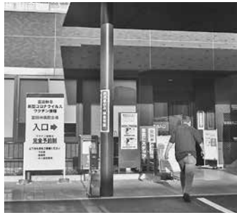
※入口では手指の消毒をお願いします。

同病院のスタッフは、5月の接種開始日からすばるホール会場での集団接種に協力いただいていたのですが、同病院に会場を移すことにより、さらにスムーズな接種体制を確保できることとなりました。