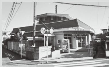
固環境衛生課(内線149)

昭和54年12月より長きにわたり営業してきましたが、施設の老朽化などが深刻であり、このまま営業を続けることが困難な状況となりましたので、3月31日(木)をもって営業を終了します。長い間ご利用をいただきありがとうございました。