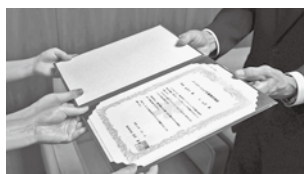
宣誓受領証交付の様子

※同制度は、本市でも令和2年7月からスタートし、現在3組がパートナーシップの宣誓をしました。