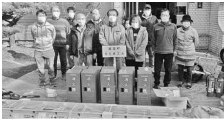
固市消防本部警備救急課 ☎(23)1125

新たに、新家地区に自主防災会が結成され、消火器、発電機、ヘルメット、ブルーシート、投光器、強力ライトなどの防災資機材が配備されました。 今後は、日頃の防災活動や地域で発生した災害へのいち早い対応など、地域防災の柱として住民の安全を確保するための活発な活動が期待されます。