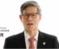
新型コロナウイルス感染症対策専門家会議 尾身 茂