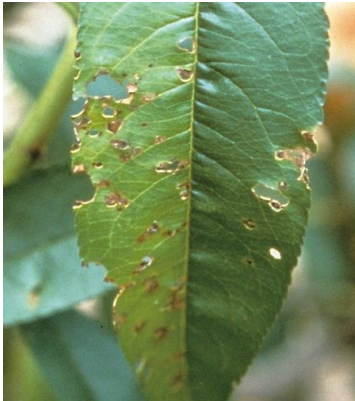
図1 葉の病斑