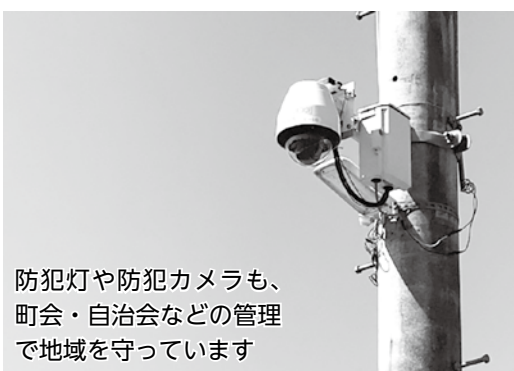
防犯灯や防犯カメラも、町会・自治会などの管理で地域を守っています

化」「住民交流」「情報提供」のように多岐に渡ります（5ページをご覧ください）。それらの活動は、普段ではあまり意識をすることがないかもしれませんが、災害時には地域住民による助け合い「共助」が非常に重要で、日頃の訓練や備えはもちろんのこと、近隣同士の人と人とのつながりの大切さが認識されています。