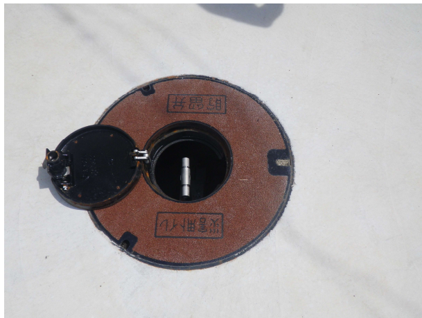
中心の小蓋のみを開ける