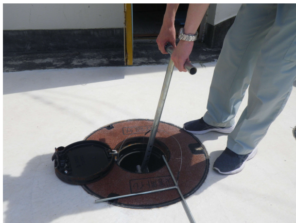
専用器具をハンドルに引っ掛けて、ゆっくり引き上げる