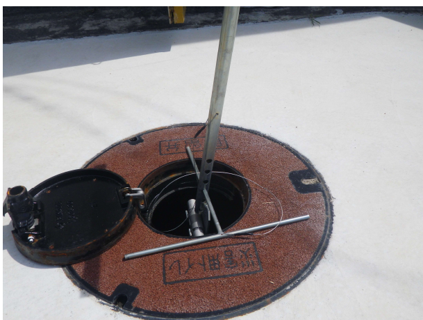
固定し、管内の排水を行う