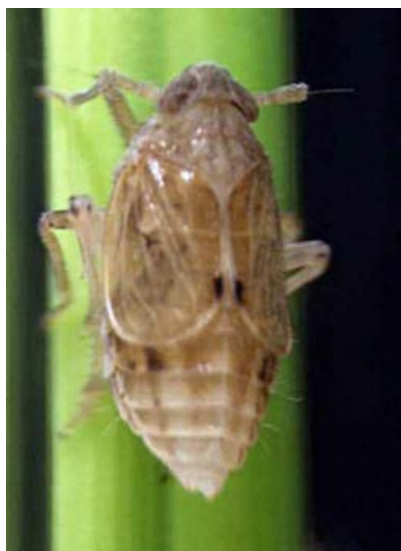
◀（参考）トビイロウンカ（短翅型・メス）