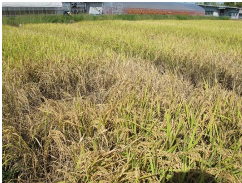
▲（参考）令和2年10月のトビイロウンカによる坪枯れ被害