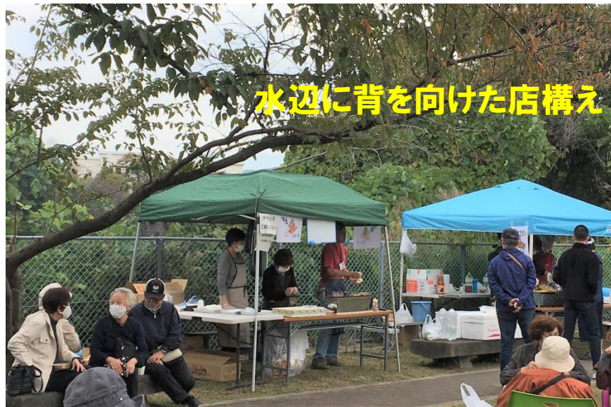
R2.11.1 寺池台五丁目親睦・交流会