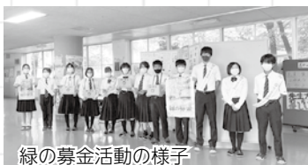
緑の募金活動の様子

合計1万8264円集まりました。葛中生徒一人一人の温かい思いをこれからも大切にしていきたいと思っております。