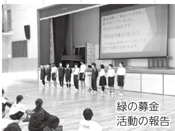
緑の募金活動の報告

6月16日より、自動販売機が導入されました。導入に向けて、生徒会を中心に全校生徒で目的や使用上のルールについて考えました。