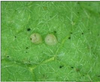
図 2: オオタバコガ卵

幼虫が蕾や果実、結球部に穴をあけて食入するのが特徴である（図 5）。大阪府内での作物への被害は、6～10 月まで続く。8～9 月の被害が最も多い。