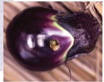
図 5: 水なすの食入痕