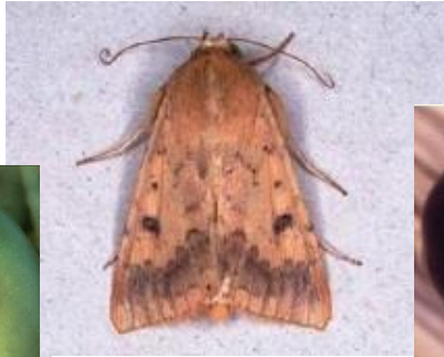
図 4: オオタバコガ雌成虫