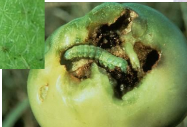
図 3: オオタバコガ幼虫