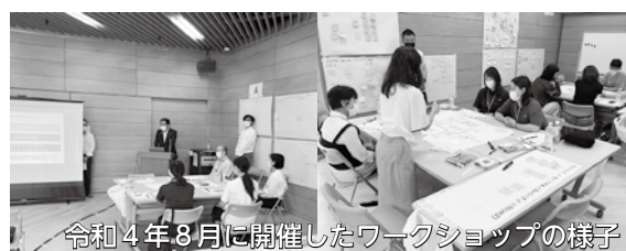
令和4年8月に開催したワークショップの様子