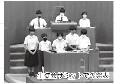
生徒会サミットでの発表

7月15日、生徒会サミットに参加しました。これまでの生徒会活動についての報告では、経験したことのない緊張感に襲われながらもやり遂げることが出来ました。噛んでしまうなど、うまくいかないこともありましたが、生徒会役員一同頑張りました。