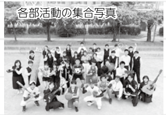
各部活動の集合写真

高校生活はあっという間に過ぎていきます。限られた高校生活3年間を河南高校で過ごしませんか。優しい先輩、先生が丁寧に指導してくれます。下記の日程で河南高校の説明会を実施します。河南高校の魅力を肌で感じてください。ぜひ参加してください。