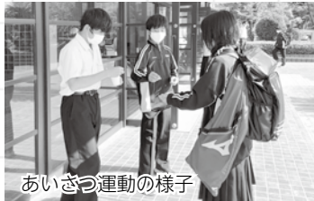
あいさつ運動の様子

藤陽中学校の生徒会です。私たちは毎週火曜日と木曜日にあいさつ運動を行っています。そこで「皆のあいさつの声をもっと大きくしたい」という意見が出たので、「藤陽 花咲かせプロジェクト」を企画しました。