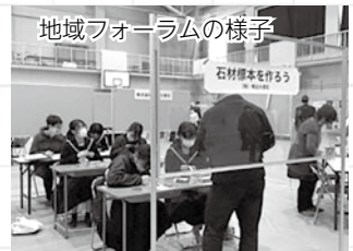
地域フォーラムの様子

この「探究」での研究成果を発表する場として、本校では毎年3月に「地域フォーラム」という科学イベントを実施しています。大学生や地域の企業もお招きし、さらに今年度は小中学生向けに楽しく科学を体験できるミニイベントも予定するなど、地域を巻き込んだ一大科学イベントです。ご興味ある方はぜひご参加ください。