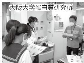
大阪大学蛋白質研究所

難しいイメージのある「科学」ですが、本校では屋久島など自然豊かな環境の中で科学を学んだり、最先端の科学的施設を訪