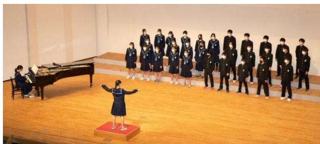
[ 文化祭 3年クラス合唱 ]