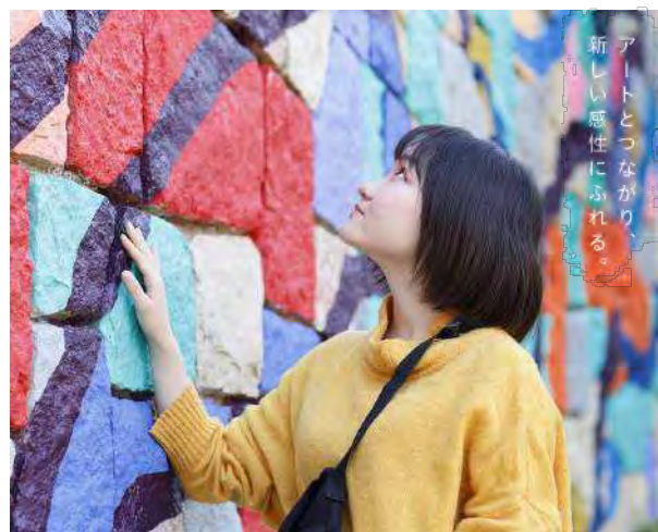
ミューラルアート「LIVING THE LIFE」