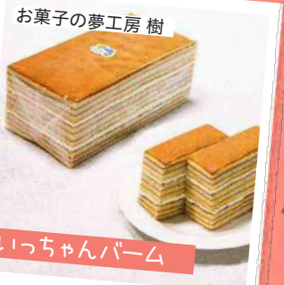
お菓子の夢工房 樹