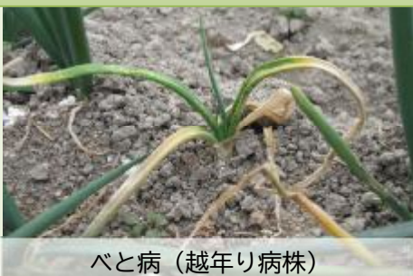
べと病（越年り病株）