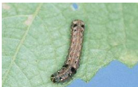
ハスモンヨトウの幼虫*