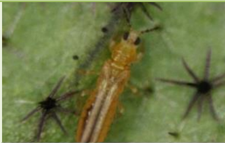
ミナミキイロアザミウマ成虫※