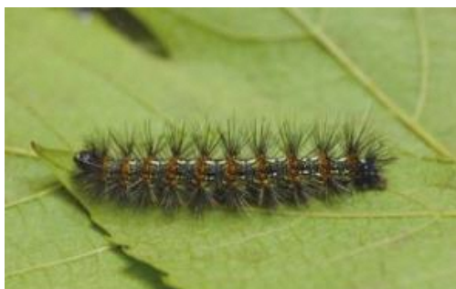
クワゴマダラヒトリの幼虫※