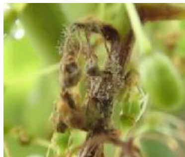
灰色かび病の症状