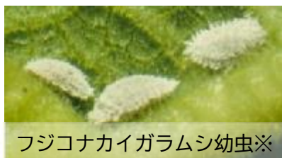
フジコナカイガラムシ幼虫※