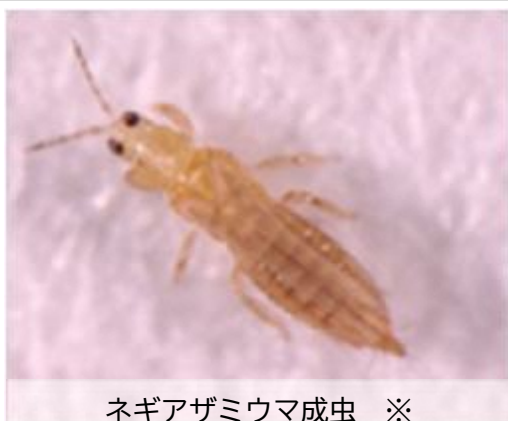
ネギアザミウマ成虫 ※