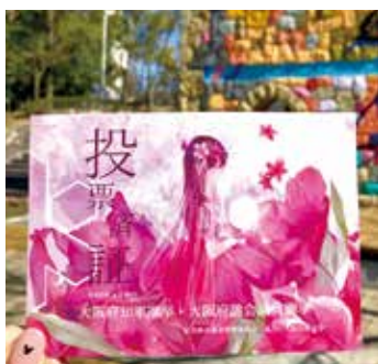
▲府知事・府議会議員選挙 (4月9日(日))

当日は、市内で活動するNPOや地域の団体など約60団体がブースを設置し、日頃の活動の様子を紹介しました。また、ステージでの発表やスタンプラリーもあり、会場はたくさんの来場者でにぎわっていました。