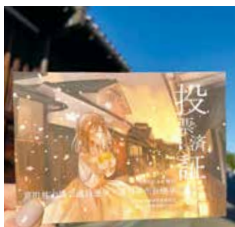
▲市議会議員・市長選挙 (4月23日(日))