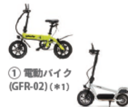
① 電動バイク (GFR-02) (*1)