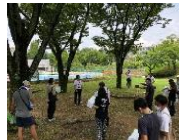
3. フィールドワーク