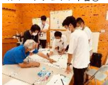
4. ワークショップ本番②