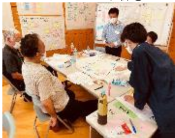
4. ワークショップ本番①