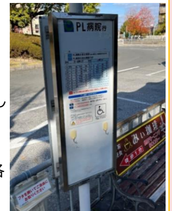
(路線バスによるPL病院への乗り入れの例)