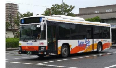
(本市内の路線バスの例)