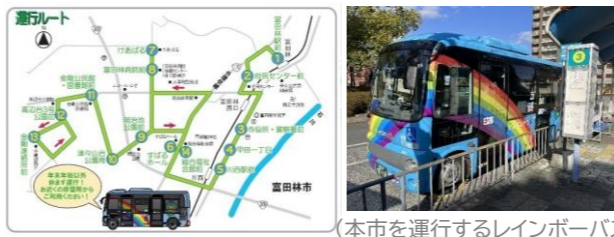
(本市を運行するレインボーバス)