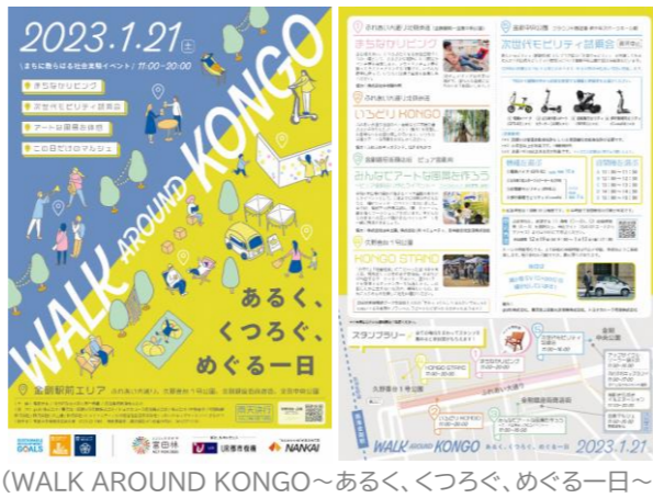
(WALK AROUND KONGO～あるく、くつろぐ、めぐる一日～)