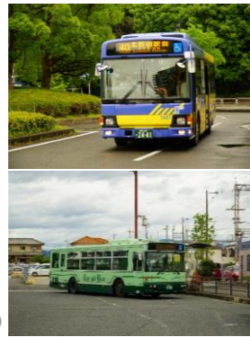
(市域を跨ぐ路線を有する路線バス)