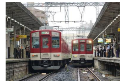
(本市内の鉄道の例)

※交通不便地域: 鉄道駅から500m以上、バス停留所から300m以上離れた地域(市内8か所が該当)のことをいいます。