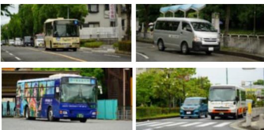
(地域の輸送資源の例)