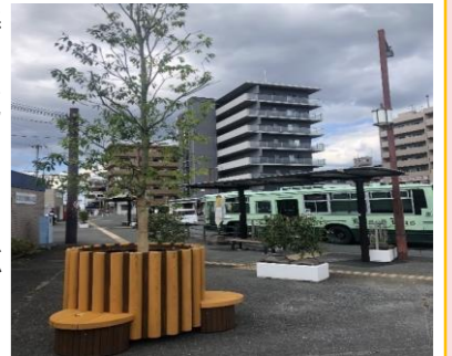
(近鉄喜志駅前におけるバス待ち環境整備の例)