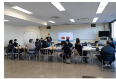
(地域の移動を考えるワークショップの例)