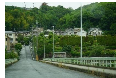
(本市内の交通不便地域の例)