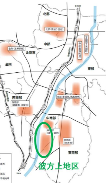
(彼方上地区では、住民の長年に渡る取組の結果、2022年度に「上セブン号」の実証運行を実施)