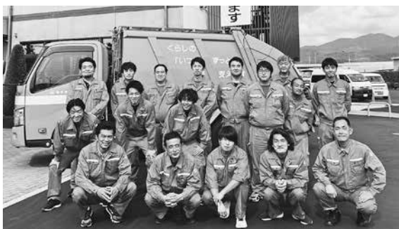
ご協力よろしくお祈いします！

今年も粗大ごみ収集中にモバイルバッテリーが爆発する事故が発生しました。 バッテリーや充電池はごみに出さないでください。 固環境衛生課（内線144）