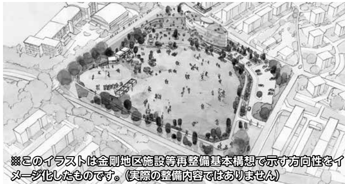
※このイラストは金剛地区施設等再整備基本構想で示す方向性をイメージ化したものです。(実際の整備内容ではありません)

本市では、金剛中央公園のリニューアルに向けた基本計画の策定を進めています。このたび基本計画の策定状況を市民の皆さんにお知らせする、中間報告会を開催します。 とき 10月20日(金)、午後7時～8時、10月21日(土)、午前10時～11時、午後2時～3時 ところ 金剛連絡所 ※公共交通機関または近隣の有料駐車場をご利用ください。 内容 基本計画の内容の中間報告(詳細機能など)