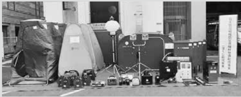
岡市消防本部警備救急課(☎(23)1125)

防災資機材は、地域の防災活動や災害時などいざというときの救助活動などへの活用が期待されます。