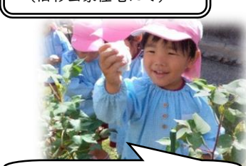
綿がたくさんとれたよ!