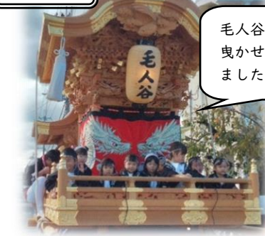
毛人谷の地車を曳かせてもらいました!