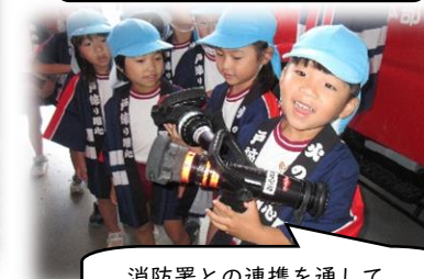
消防署との連携を通して、防災意識を高めています!