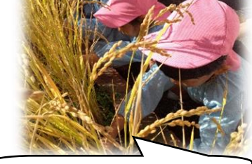
おにぎりパーティーが楽しみ!