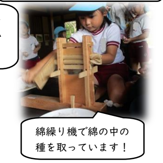
綿繰り機で綿の中の種を取っています!