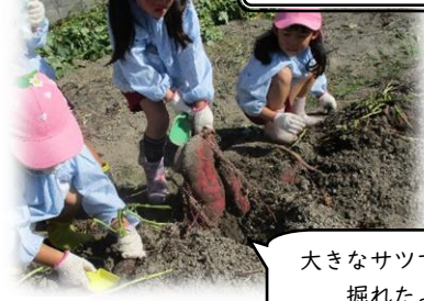
大きなサツマイモが掘れたよ!