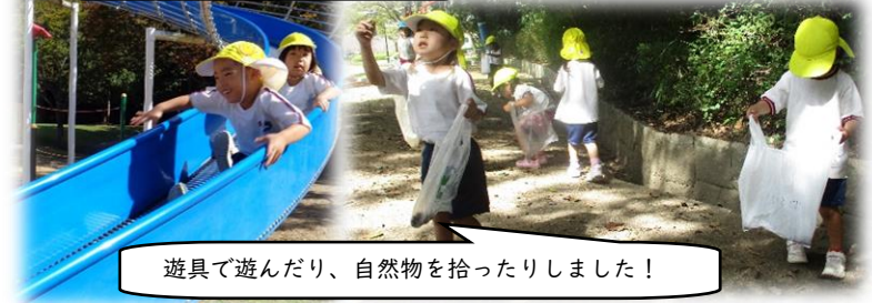
遊具で遊んだり、自然物を拾ったりしました!