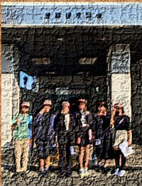
市議会前にて記念撮影！

10月18日に富田林市議会で行われた小学生サミットに6年生の代表委員が参加しました。ふじさわまつりや学校のゆるキャラ等、たくさんの学校自慢を披露してきました。学校の代表として、とても素晴らしい活躍ですね。