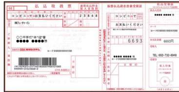
コンビニ払込用紙