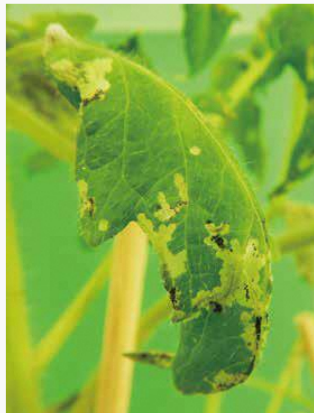
図3 トマト葉の被害