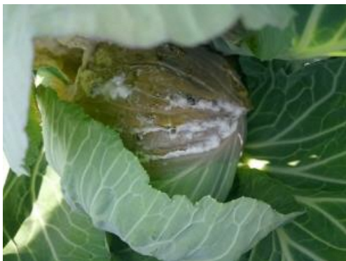
キャベツでの発生