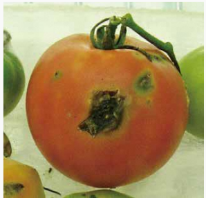
図4 トマト果実の被害