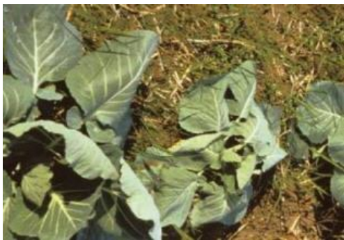
キャベツのしおれ症状と生育不良*