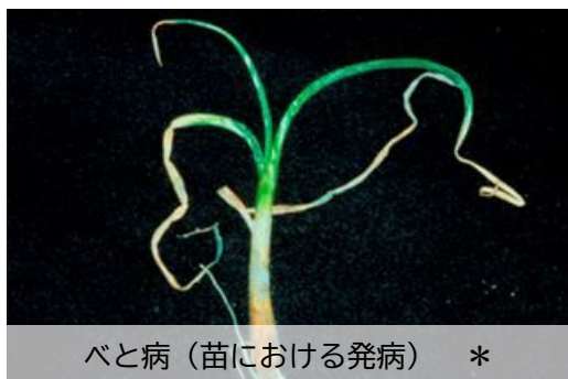
ベと病（苗における発病） *