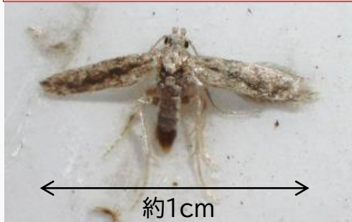
図1 府内で誘殺された成虫