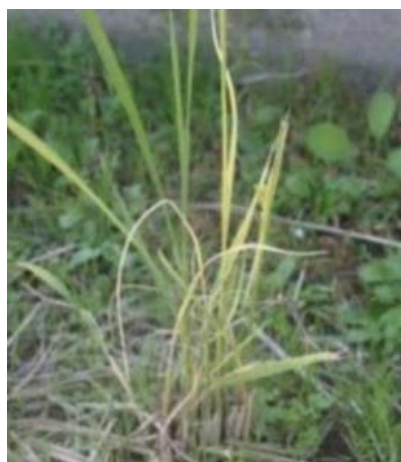
縞葉枯病(ひこばえでの病徴)