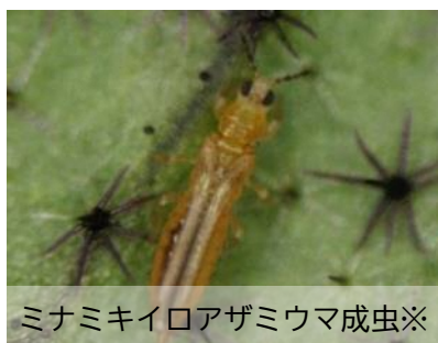
ミナミキイロアザミウマ成虫※