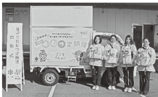
見守り配達員の皆さん