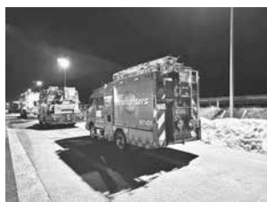
被災地へ向かう本市消防車