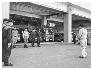
吉村市長への出動報告