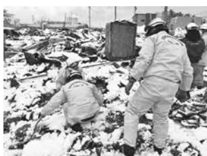
輪島市での火災現場の掘り起こし活動