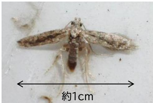
図1 府内で誘殺された成虫