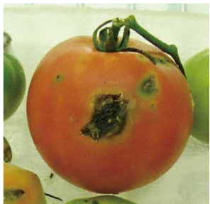
図4 トマト果実の被害