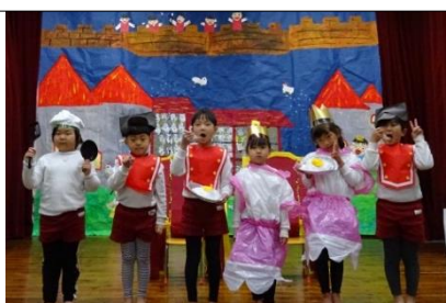
5歳児「おしゃべりなたまごやき」