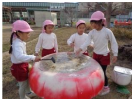
氷あそびが大好き