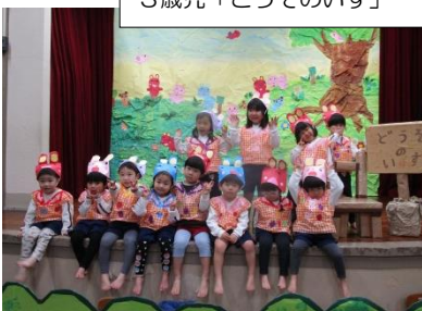
3歳児「どうぞのいす」