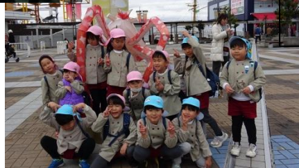
給食センター 見学