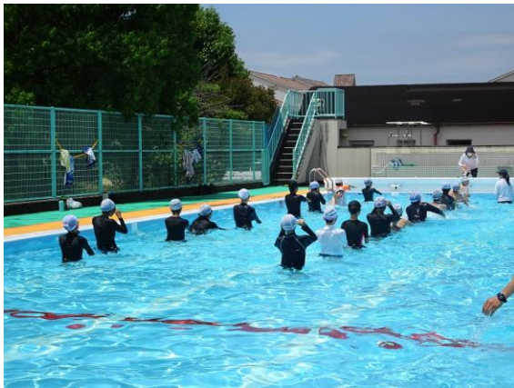
前後左右の間隔を保って授業を受けています。

今年度、3年ぶりに水泳指導を行いました。低学年の児童は入学して初めて向陽台小学校のプールに入りました。久々のプール、暑い日ということもあって、子どもたちも先生たちも気持ちよさそうでした。