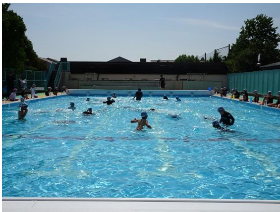
夢中で宝探しをしています。