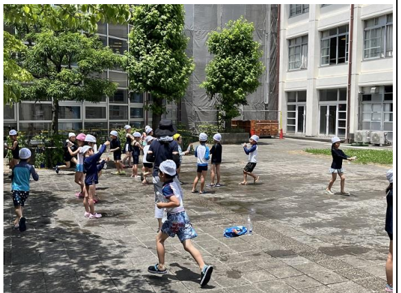
1年生は水着に着替えて、水遊びです。