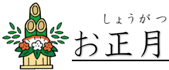
しょうがつ お正月

大みそかに食べるそばを、年越しそばと呼びます。年越しそばを食べる理由は、そばのように細く長くすごせる(長生きできる)ように、また、そばは切れやすいため、今年の苦労や不運を切り捨てて新しい年をむかえられるように、といった願いがこめられているからです。そば以外のものを食べる地域もあるそうです。