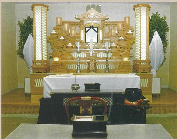
斎場葬儀室を使用した場合の 標準プラン飾付け例